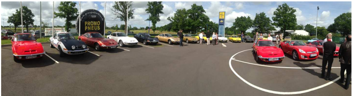
Et photo de famille